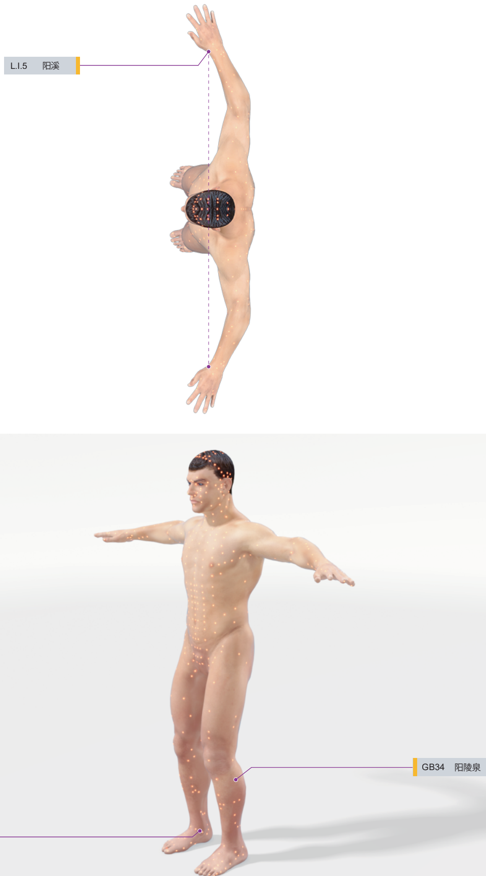
Схема акупунктурных точек

Методика акупунктурной терапии соответствует Стандартной Акупунктурной Номенклатуре (ВОЗ 1993 г.).