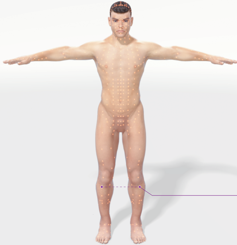
Схема акупунктурных точек